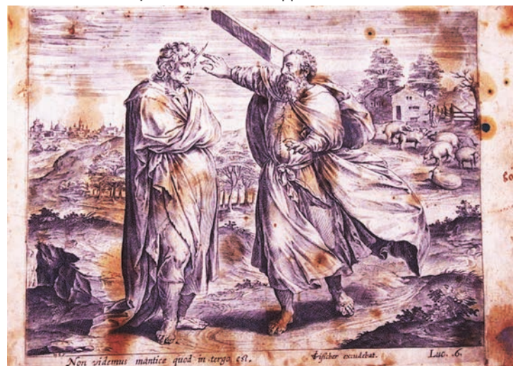
Старовинна гравюра «Притча про колоду і скалку в оці» (Біблія Піскаратора – Theatrum Biblicum, Амстердам, видання 1643 року.)

Архієрея і Московського патріарха найближчим часом – питання зависло в повітрі. Така потреба не лише наспіла, вона – переспіла. І про це говорить той же протодіякон Кураєв: «Бажання Папи Римського провести зустріч з Російською Православною Церквою – традиційне для понтифіків протягом останніх десятиліть». І додає: «Зараз м'яч – на половині поля патріарха. Тому тепер слово за главою Православної Церкви, тим більше, що Папа Римський заявив про готовність