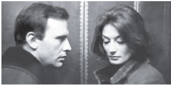
Кадр з фільму «Чоловік та жінка» (1966) Клода Лелуша. Цей шедевр світової кінокласики усіх часів та народів про кохання отримав «Гран-прі» в Канах (1966)

Серед людей панує переконання, що саме жінка – слабка й делікатна. При цьому статистика подає: чоловіки втричі частіше