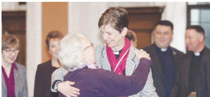
Вона називатиметься єпископом Стокпортським