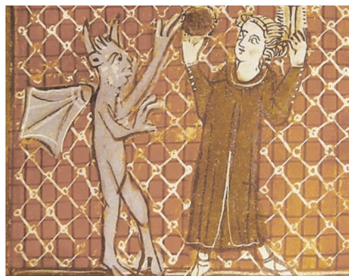
Сатана спокушає ченця. Ілюстрація до Бreviарія XIV століття.

сягнення ти знищив своїм падінням. Але встань і почни спочатку.