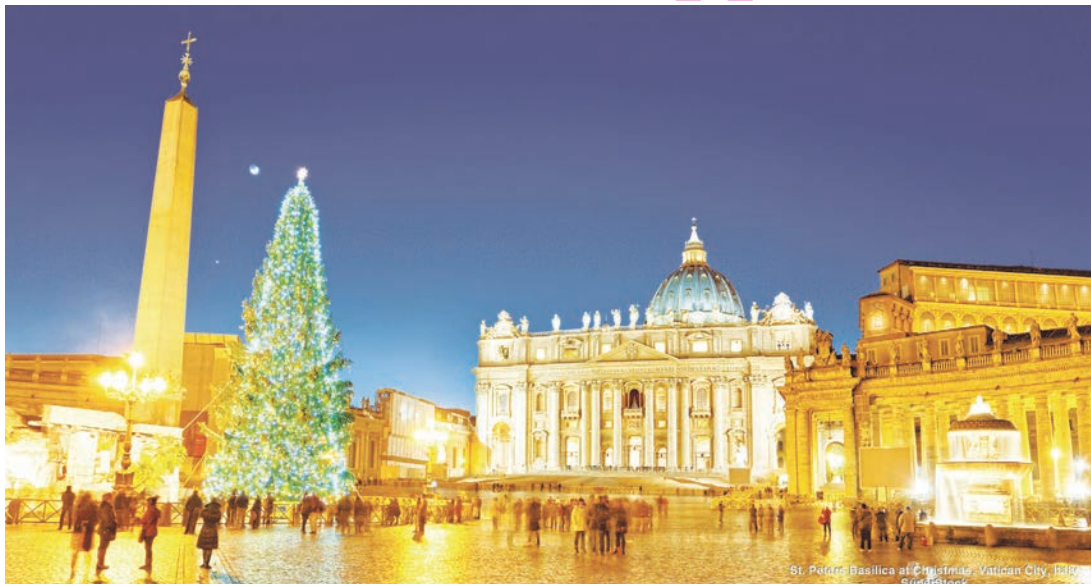
St. Peter's Basilica at Christmas, Vatican City, Italy

Наказ імператора спонукав святого Йосифа вирушити разом зі своєю Обручницею у подорож. Не знаючи цього, імператор спричинився до здійснення пророцтва про місце народження Месії. Таким чином, переплелися історія спасіння та історія римської імперії. Історія Бо-