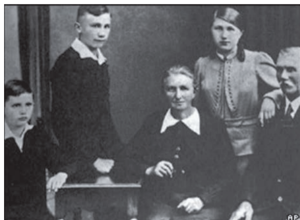
Йосип Ратцингер (крайній ліворуч), що став Папою Венедиктом XVI, народився в сільській Німеччині в 1927 році.

охопленою марксистськими віяннями. Професор Ратцингер різко виступає проти “інструменталізації тиранічних ідеологій”. У 1969 р. конфлікт Ратцингера з ліберальними тюбінгенськими