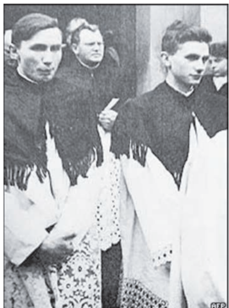
У 1951 році Йосип Ратцингер і його брат Георг (ліворуч) стали священиками в місті Фрайзінг, на півдні Німеччини

Майбутній Папа Венедикт XVI народився 16 квітня 1927 р. у містечку Маркіль-ам-Інн у Баварії, у родині поліцейського. У дворічному віці його родина переїхала на австрійську територію, а в 1932 р. — в альпійське містечко Аушау. Батько Ратцингера, який негативно відносився до націонал-соціалізму, віддав сина в