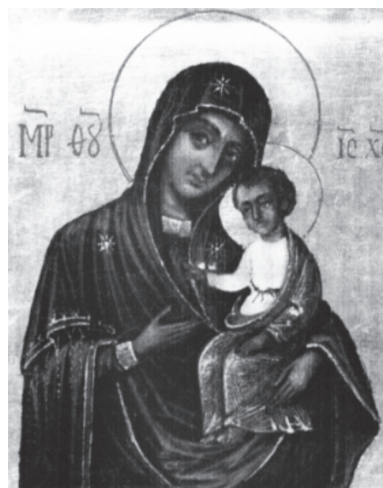
Махновецька чудотворна ікона Матері Божої XVI-XVII ст.