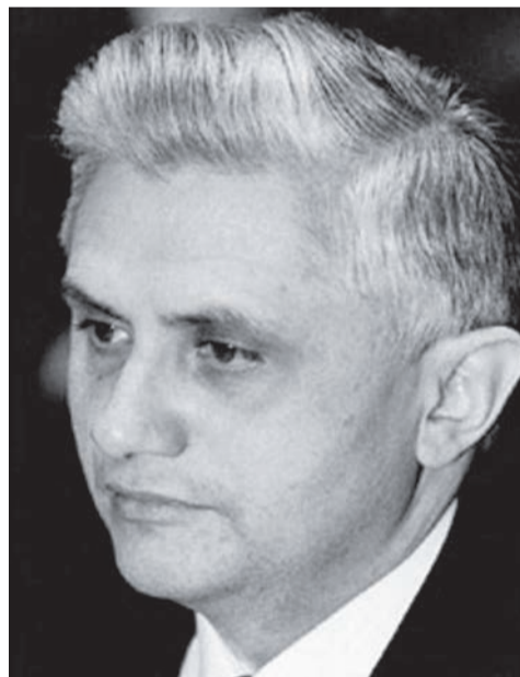
Інтелектуал і вчений. В 1960-і роки Ратцингер учився в Університеті міста Тюбінгена

Г.У. фон Бальтазаром, Анри де Любаком і іншими засновує богословський католицький журнал “Communio” (“Причастя”), присвячений питанням богослов'я і культури. 24 березня 1977р., незважаючи на своє небажання, Ратцингер був призначений архієпископом Мюнхенським і Фрайзінгським. Як єпископське гасло він вибрав слова з Третього послання Іоанна “Сотрудник істини”. У своїх спогадах Ратцингер говорить, що цим девізом він хотів об'єднати свою колишню роботу викладача і нове служіння. Крім того, у сучасному світі, вважав він, тема правди є найбільш актуальною.