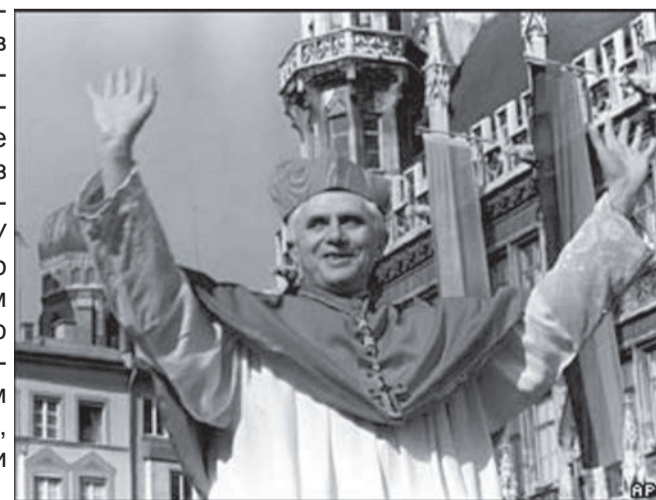
Ратцингер став кардиналом у 1977 році і виявив себе прихильником строгих релігійних догм.

Церемонія хіротонії відбулася 28 травня, а вже