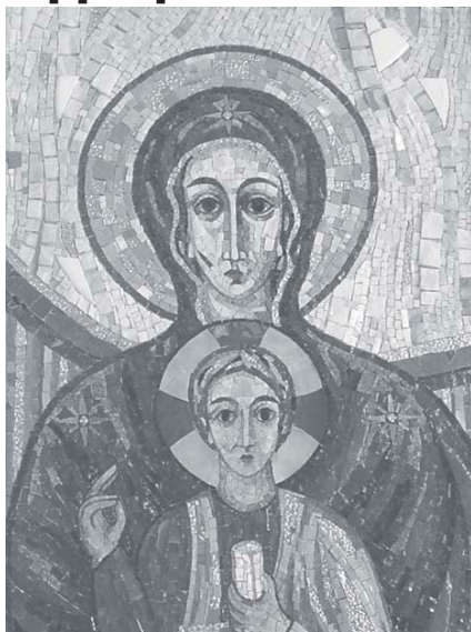
Ікона "Престія Премудрості" першою вітала Папу Івана Павла II у храмі Різдва Пресвятої Богородиці.

До свого празника сихівчани готувалися заздалегідь. У попередню неділю силами парохіальних музичних колективів